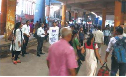
विद्या प्रसारक मंडळाचे तंत्रनिकेतन

३. दिनांक १५ ऑक्टोबर २०१९ रोजी आमच्या महाविद्यालयाच्या विद्यार्थ्यांनी ठाणे रेल्वे स्टेशन व सिडको बस स्टॉप येथे पथनाट्याच्या माध्यमातून मतदार जागृती करण्याचा प्रयत्न केला. यावेळी विद्यार्थ्यांनी विविध लोकांच्या प्रश्नाचे देखील समाधानकारक उत्तर दिले.