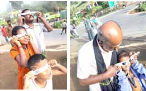
उत्साहाने ग्रहण बघणारी स्थानिक मुले

इच्छित स्थळी पोहोचल्यावर आम्ही आमचे कॅमेरे सज्ज करून ग्रहण लागण्याची वाट पाहू लागलो. आम्हाला जास्त वेळ वाट पाहावी लागली नाही. ग्रहणाला सुरुवात झाली. सूर्याचा वरचा भाग क्रमाक्रमाने झाकला जाऊ लागला. आम्ही काळ्या फिल्मचे चश्मे घेऊनच गेलो होतो. त्यातून आम्ही सूर्याकडे पाहात आहोत हे तेथल्या लोकांच्या लक्षात आले. त्यांनी सूर्य पाहण्याची इच्छा व्यक्त केली. अशावेळेस उपयोगी पडतील म्हणून आम्ही जास्तीचे गॉगल्स नेले होते. ते त्यांना दिले. शेजारी राहणाऱ्या एका माणसाने ग्रहण पाहिल्यावर बाईने ग्रहण पाहिले तर चालेल काय? अशी विचारणा केली. आम्ही होकारार्थी मान हलविताच तो घरात जाऊन आपल्या पत्नीला घेऊन आला. नंतर दोघांनीही ग्रहणाचा मनसोक्त आनंद लुटला. आमच्या भोवतीतर लहान मुलांचा गराडाच पडला होता. त्यानादेखील ग्रहण बघण्याची दूर्मीळ संधी मिळाली.