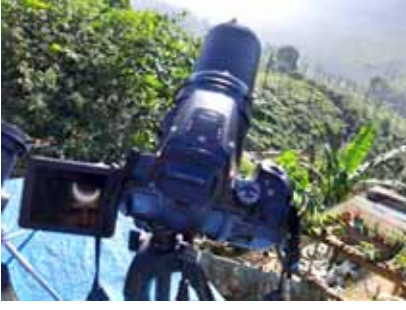
डोंगरकड्यावरील आमचे स्थान

इच्छित स्थळी पोहोचल्यावर आम्ही आमचे कॅमेरे सज्ज करून ग्रहण लागण्याची वाट पाहू लागलो. आम्हाला जास्त वेळ वाट पाहावी लागली नाही. ग्रहणाला सुरुवात झाली. सूर्याचा वरचा भाग क्रमाक्रमाने झाकला जाऊ लागला. आम्ही काळ्या फिल्मचे चश्मे घेऊनच गेलो होतो. त्यातून आम्ही सूर्याकडे पाहात आहोत हे तेथल्या लोकांच्या लक्षात आले. त्यांनी सूर्य पाहण्याची इच्छा व्यक्त केली. अशावेळेस उपयोगी पडतील म्हणून आम्ही जास्तीचे गॉगल्स नेले होते. ते त्यांना दिले. शेजारी राहणाऱ्या एका माणसाने ग्रहण पाहिल्यावर बाईने ग्रहण पाहिले तर चालेल काय? अशी विचारणा केली. आम्ही होकारार्थी मान हलविताच तो घरात जाऊन आपल्या पत्नीला घेऊन आला. नंतर दोघांनीही ग्रहणाचा मनसोक्त आनंद लुटला. आमच्या भोवतीतर लहान मुलांचा गराडाच पडला होता. त्यानादेखील ग्रहण बघण्याची दूर्मीळ संधी मिळाली.