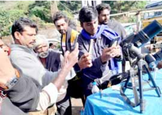
ग्रहण बघायला आलेल्या लोकांची गर्दी

मागील वर्षी डिसेंबर महिन्यात खगोलीय घटनांचा मागोवा घेणाऱ्या लोकांच्या गोटात फारच उत्साह होता. त्याला कारणही तसेच होते. निसर्गाने त्यांच्यासाठी एका दूर्मीळ अशा घटनेची व्यवस्था करून ठेवली होती. डिसेंबर महिन्याच्या २६ तारखेला सूर्यग्रहण होते आणि तेही कंकणाकृती. हे दूर्मीळ दृश्य भारताच्या दक्षिणेकडील राज्यातून दिसणार होते. त्यासाठी देशाच्या मध्य, उत्तर आणि पूर्व भागात राहणाऱ्या लोकांनी दक्षिण भारतात गर्दी केली होती. खगोल मंडळाच्या अनेक सभासदांनी दक्षिण भारतात जाण्याची योजना आधीच आखून ठेवली होती. दक्षिणेकडे जाणाऱ्या गाड्यांची तिकिटे तर लोकांनी घेतलीच; त्याचबरोबर जेथे जायचे तेथील हॉटेलचे आरक्षण देखील त्या लोकांनी करून ठेवले होते. त्यामुळे तमिलनाडू आणि केरळ या राज्यातील अनेक हॉटेलांना चांगला व्यवसाय मिळाला. या निमित्ताने भारताच्या वेगवेगळ्या राज्यांमधील लोक भारताच्या दक्षिण भागात एकत्र आले होते.