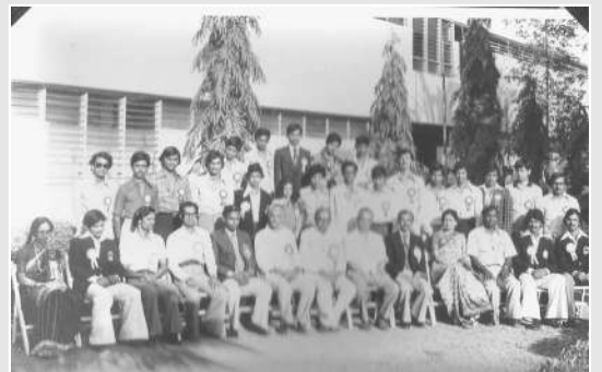
विद्यार्थी संसद (१९७९-८०)