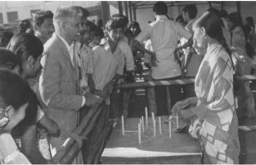
N.S.S. Fun Fair मध्ये सहभागी झालेल्यांबरोबर संभाषण करताना (१९७५-७६)