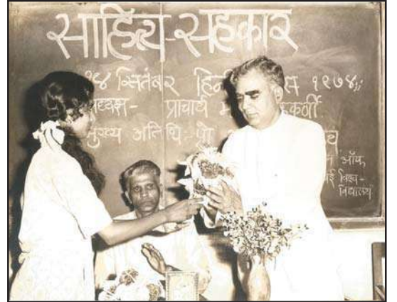
साहित्य सहकार (१९७४)