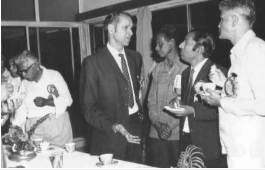
बापू नाडकर्णी यांच्या समवेत (१९७५-७६)