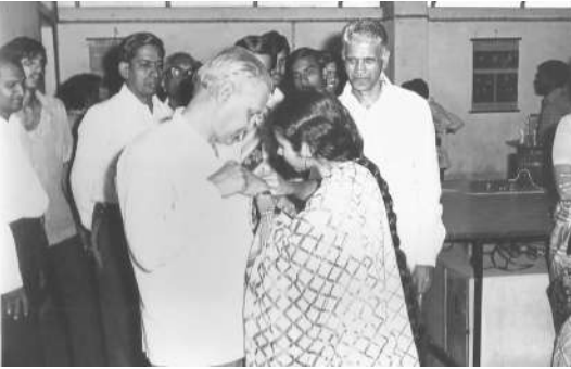
वार्षिक स्नेहसंमेलन प्रसंगी प्रमुख पाहुणे प्रा. भालबा केळकर (१९७८-७९)