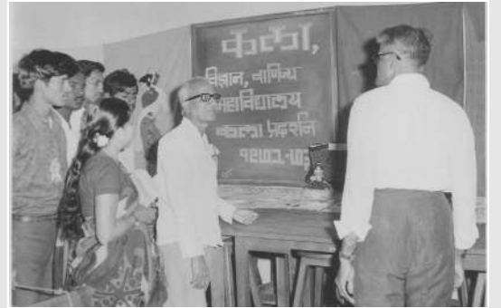
विज्ञान, वाणिज्य, कला प्रदर्शन (१९७२-७३)