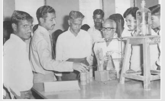
विज्ञान वाणिज्य कला प्रदर्शनात प्रात्याक्षिकाचे निरिक्षण करताना