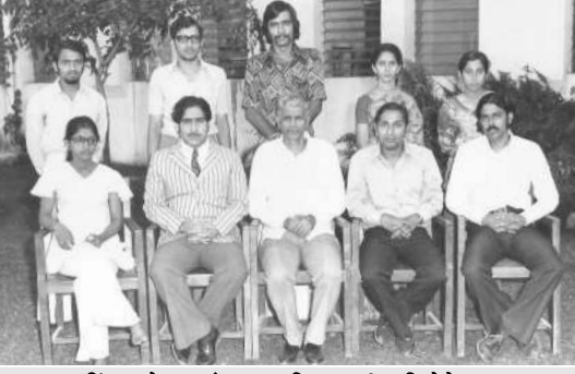
बॅडमिंटन चेस आंतर महाविद्यालयीन विजेते व उपविजेते (१९७५-७६)