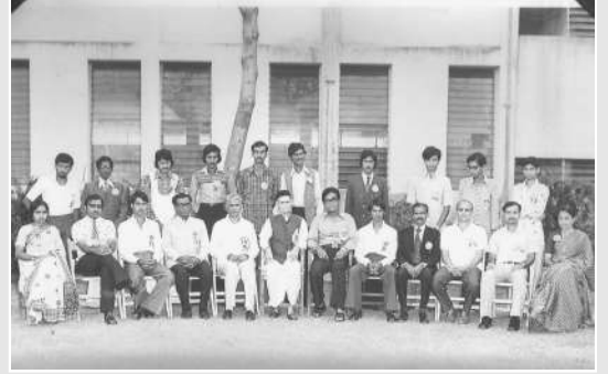
विद्यार्थी संसद (१९७७-७८)