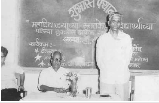
महाविद्यालयाचा स्नातकेच्छ विद्यार्थ्यांच्या पहिल्या तुकडीस हार्दिक शुभेच्छा देताना!