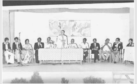
विद्यार्थी संसद (१९७८-७९)