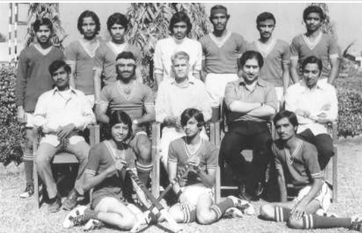
हॉकी संघ झोन-V उपविजेते (१९७५)