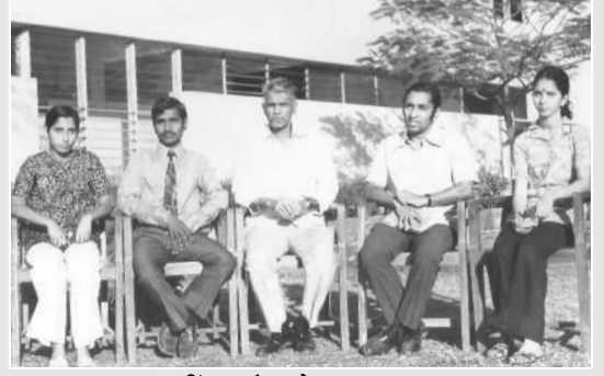
बॅडमिंटन संघ झोन-V (१९७५)