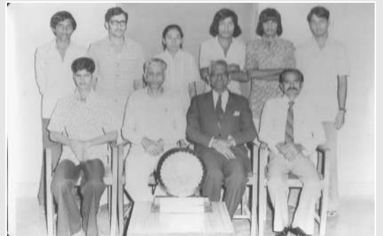
जिमखाना कमिटी (१९७६-७७)