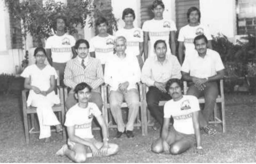
कब्बडी संघ (१९७५-७६)