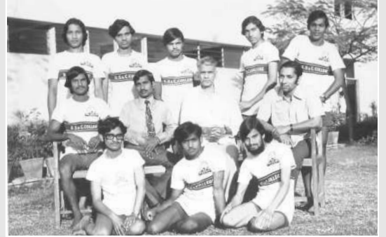
कब्बडी संघ झोन-V (१९७५)