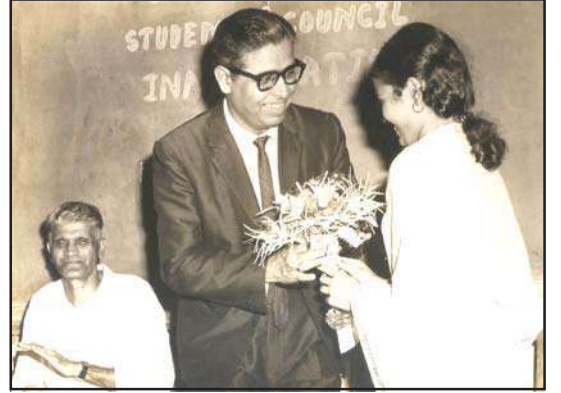
स्टुडेंट कौन्सिल (१९७४)