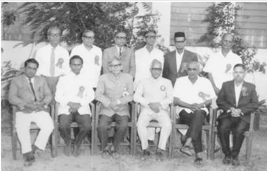
संचालक समिती विद्या प्रसारक मंडळ व प्रमुख पाहुणे एस. एम. जोशी (१९७२-७३)