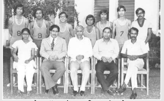
बास्केट बॉल आंतर महाविद्यालयीन झोन-V उपविजेते (१९७५-७६)