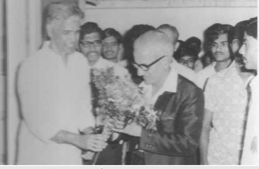
विज्ञान प्रदर्शन उद्घाटन (१९७१-७२)