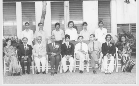
विद्यार्थी संसद (१९७६-७७)