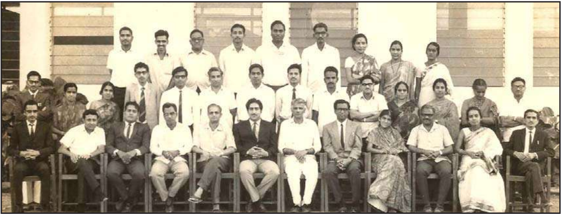
अध्यापक वर्ग १९७१-७२