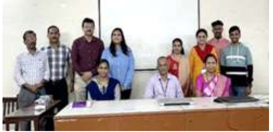
अँडवान्स डिप्लोमा कोर्सेसचे गुणवंत विद्यार्थी

डॉ. वा. ना. बेडेकर व्यवस्थापन अभ्यास संस्था, ठाणे