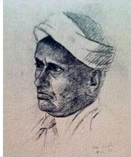
विख्यात शास्त्रज्ञ चंद्रशेखर व्यंकट रमण