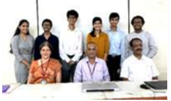
कॉम्प्युटर इंजिनिअरिंग विभागाचे गुणवंत विद्यार्थी