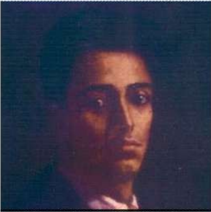
भाभा १७ वर्षांचे असतानाचे स्वतःचेच रेखाचित्र