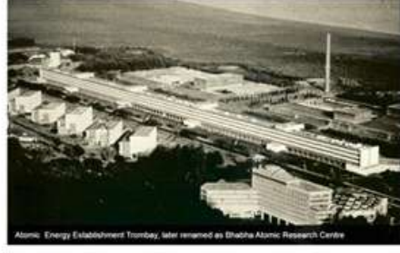
ऍटोमिक एनर्जी एस्टॅब्लिशमेंट. हिचेच नाव पुढे भाभा अणुसंशोधन केंद्र असे झाले. तशाच व्ही-आकारांच्या स्तंभांवर उभी असलेली मॉड्युलर लॅबोरेटरी