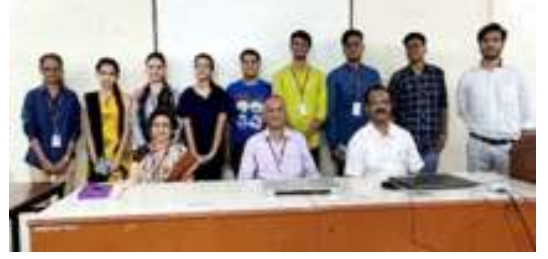
प्रथम वर्ष डिप्लोमाचे गुणवंत विद्यार्थी