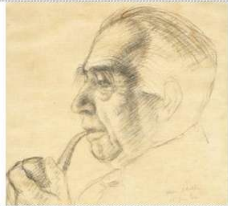
विख्यात शास्त्रज्ञ नील्स बोहर

भीतीमधून काळजी निर्माण होते; आणि काळजीने ग्रासले की समाधान अंतर्धान पावते.