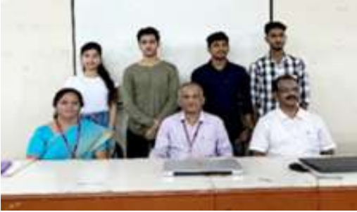
इलेक्ट्रिकल पॉवर सिस्टीम विभागाचे गुणवंत विद्यार्थी