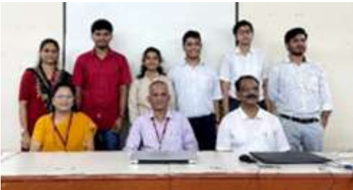
इंडस्ट्रिअल इलेक्ट्रॉनिक्स विभागाचे गुणवंत विद्यार्थी