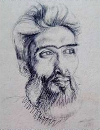
प्रसिद्ध चित्रकार मकबूल फिदा हुसेन