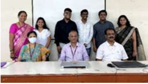
इन्स्ट्रुमेंटेशन विभागाचे गुणवंत विद्यार्थी