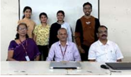
इन्फॉर्मेशन टेक्नॉलॉजी विभागाचे गुणवंत विद्यार्थी