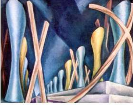
भाभांचे एक अमूर्तचित्र (ऍबस्ट्रॅक्ट पेंटिंग)