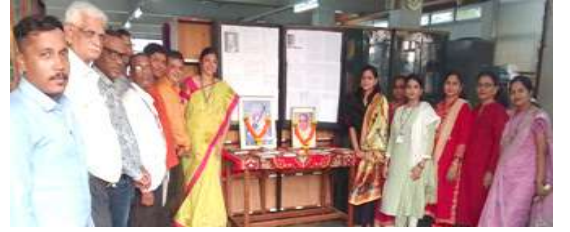
यशवंतराव चव्हाण महाराष्ट्र मुक्त विद्यापीठ माजी विद्यार्थी स्नेहसंमेलन