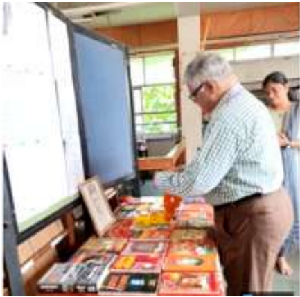
स्वातंत्र्यवीर विनायक दामोदर सावरकर जयंती