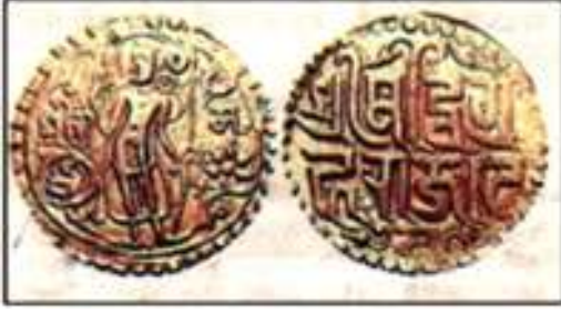
विग्रहराज चतुर्थाचे श्रीराम लिहिलेले

एखादं नाणं फक्त चलन नसून राजाचं संदेश वाहून नेणारं शक्तिशाली माध्यम असते, हे या लेखावरून समजते - संपादक