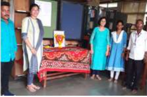
महात्मा बसवेश्वर जयंती

पुण्यश्लोक अहिल्याबाई होळकर यांच्या २९७ व्या जयंती निमित्त ३१ मे २०२२ रोजी अहिल्याबाई होळकर यांच्यावरील पुस्तकांचे व माहितीचे प्रदर्शन ग्रंथालयात भरवण्यात आले.