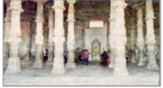
अजयमेरूचे सरस्वती कंठाभरणं संस्कृत

प्रस्तुतची बातमी अगदीच किरकोळ. पण, त्या अनुषंगाने गतकाळात डोकावलो, तर आपण पोहोचतो ते देदीप्यमान इतिहास लाभलेल्या चाहमान(चौहान) या हिंदू राजांच्या वंशावळीपर्यंत. हे दुर्मीळ नाणं बाराव्या शतकातील साकंबरी (सांबर) येथील चाहमान (चौहान)