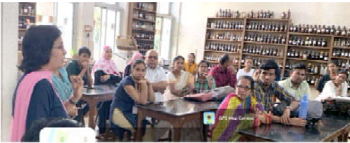
वनस्पती शास्त्र विभाग

पालकसभेच्या माध्यमातून पालकांना महाविद्यालयात आयोजित करणाऱ्या केल्या जाणाऱ्या विविध उपक्रम, पाल्याची प्रगती व विविध योजना याबद्दल माहिती देण्यात येते. महाविद्यालय व पालक यामध्ये सुसंवाद साधता येतो. वनस्पती शास्त्र विभागातर्फे २१ जानेवारी २०२३ रोजी पालक सभा द्वितीय आणि तृतीय वर्ष विज्ञान शाखेच्या विद्यार्थ्यांकरता आयोजित करण्यात आली होती. या पालक सभेला ११ विद्यार्थ्यांच्या पालकांनी आपली उपस्थिती नोंदवली. भौतिकशास्त्र विभागातर्फे २८ जानेवारी २०२३ रोजी पालक सभा द्वितीय आणि तृतीय वर्ष विज्ञान शाखेच्या विद्यार्थ्यांकरता आयोजित करण्यात आली होती. या पालक सभेला २३ विद्यार्थ्यांच्या पालकांनी आपली उपस्थिती नोंदवली.