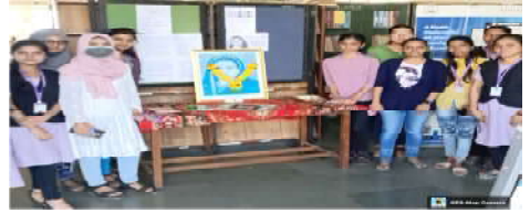
सावित्रीबाई फुले जयंती

ग्रंथालय विभागातर्फे विविध दिन, थोर व्यक्तींच्या प्रतिमेला पुष्पहार अर्पण करून, तसेच त्यांच्यावरील माहितीचे प्रदर्शन व पुस्तक प्रदर्शन भरवून साजरे करण्यात आले. ०३ जानेवारी २०२३ रोजी सावित्रीबाई फुले जयंती, १२ जानेवारी २०२३ रोजी जिजाऊ मांसाहेब जयंती, तसेच स्वामी विवेकानंद जयंती, २३ जानेवारी २०२३ रोजी नेताजी सुभाषचंद्र बोस जयंती, तसेच बाळासाहेब ठाकरे जयंती आणि ३० जानेवारी २०२३ रोजी महात्मा गांधी पुण्यतिथी साजरी करण्यात आली.