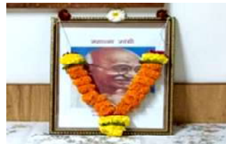
महात्मा गांधी पुण्यतिथी

नेताजी सुभाषचंद्र बोस जयंती व बाळासाहेब ठाकरे जयंती