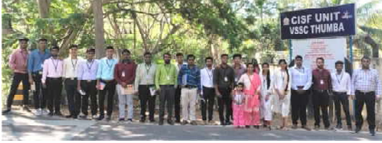
Vikram Sarabhai Space Center, Thiruvananthapuram, Kerala