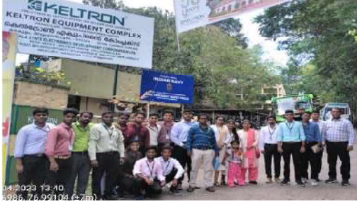
Industrial visit by Keltron Kerala State Electronics Company

केरळ येथे औद्योगिक अभ्यास दौरा: महाविद्यालयातील इलेक्ट्रॉनिक्स व टेलिकम्युनिकेशन अभियांत्रिकी विभाग तसेच इन्स्ट्रुमेंटेशन अभियांत्रिकी विभागाचा सहभाग.