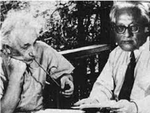
दोन सहकारी : अल्बर्ट आईनस्टाईन आणि सत्येंद्रनाथ बोस

अध्यापनाबरोबरच सत्येंद्रनाथ बोस संशोधनाला देखील पुरेसा वेळ देत असत. आपल्या संशोधनावर